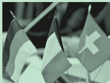
Visite du ministre-président du Land Bade-Wurtemberg, Winfried Kretschmann.