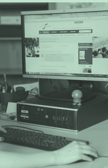
De nouvelles applications au service des personnels.

Afin de ne pas multiplier les outils et dans l'optique de mutualiser les solutions ou les plateformes au niveau régional et national, de nouvelles applications ont fait leur apparition dans le quotidien des personnels administratifs. La mise en place de la nouvelle offre de formation a, par exemple, nécessité la mise en place de l'outil ROF, pour Référentiel de l'offre de formation. Grâce à ce nouveau référentiel, l'offre de formation de l'Université de Strasbourg est désormais renseignée et actualisée en un lieu unique, pour une diffusion fiabilisée d'informations. Ce logiciel, développé par l'Agence de mutualisation des universités et des établissements