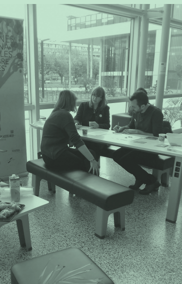
Atelier au Centre de culture numérique.

— Au quotidien près de 130 personnels initient, organisent et participent au maintien de l'ensemble du système d'information de l'établissement et de ses partenaires.